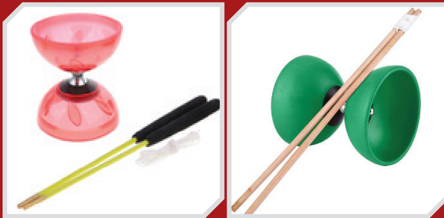
Permainan tradisional Yo-yo cina

berasal dari negeri Perak adalah seorang tokoh yang membawa Yo-yo Cina ini ke Malaysia. Beliau merupakan graduan daripada National Taiwan Normal University , Taiwan. Beliau merupakan antara individu yang mempromosikan Yo-yo Cina sehingga digelar sebagai bapa Yo-yo Cina Malaysia. Feng seorang guru yang sering terlibat dengan masyarakat setempat khususnya dari kalangan komuniti Cina telah berhasrat untuk merubah cara mengisi masa lapang anak muda dan juga pelajarinya daripada terus terbuang begitu sahaja dengan perkara-perkara yang tidak berfaedah. Lanjutan hasratnya untuk merubah tabiat buruk komuniti setempat, beliau telah nekad untuk pergi ke Taiwan bagi mempelajari satu permainan kuno Cina yang sudah popular sejak sekian lama di peradaban wilayah China itu. Yo-yo Cina menjadi pilihannya kerana kos permainan yang tidak mahal juga mempunyai ciri-ciri permainan yang menarik serta sesuai untuk anak muda tempatan telah memikat hatinya untuk mempelajari dan membawa pulang ilmu tersebut ke tanah air untuk disebar secara meluas. Selain itu, Feng turut mempelajari cara untuk menubuhkan sesebuah persatuan ataupun kumpulan permainan Yo-yo Cina bagi mengukuhkan kedudukan Yo-yo Cina apabila permainan ini sudah bertapak di Malaysia kelak .