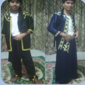
Gambar 1: Badju kuput dan sawwal kuput (di sebelah kiri) dan Badju Lapi dan sawwal kantiyu (di sebelah kanan). Tumbuko bulawan (butang keemasan) menghiasi busana.

Pemakaian badju kuput dan badju lapi ini juga turut dipakai oleh Panglima Mat Salleh seorang pahlawan negeri Sabah yang menentang pemberontakan Inggeris pada abad ke 19. Berdasarkan lakaran gambar 2, Panglima Mat Salleh memakai kamasita dan badju kuput , memakai kandit ( kain ikat pinggang ) dan memakai sawwal kuput ( seluar sempit ). Dalam bahasa Suluk, sawwal bermaksud seluar dan kuput bermaksud sempit yang merujuk kepada reka bentuk seluar tersebut. Reka bentuk busana ini menyerlahkan karisma dan kepimpinan Panglima Mat Salleh.